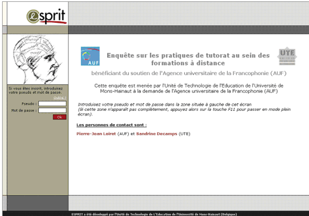
Figure 1 : La page d'accueil qui donne accès au dispositif de recueil de données

Ces trois questionnaires s'adressent aux responsables pédagogiques, aux tuteurs et aux apprenants ont été mis en ligne à partir du dispositif de recueil de donnée conçu par l'Unité de Technologie de l'Éducation (url : http://ute2.umh.ac.be/enquete-tutorat/ ). 3